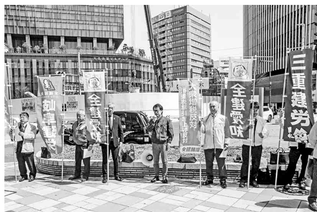
名古屋駅前で大衆増税反対を訴える役員一同

内容 「まだ登録していない」と言われた方や、「本当は登録しなくてよかった」のでは?と感じている方へ、改めて制度を理解していただく内容です。また、いわゆる「2割特例」や「8割控除」が終わった後についても詳しくご説明します。