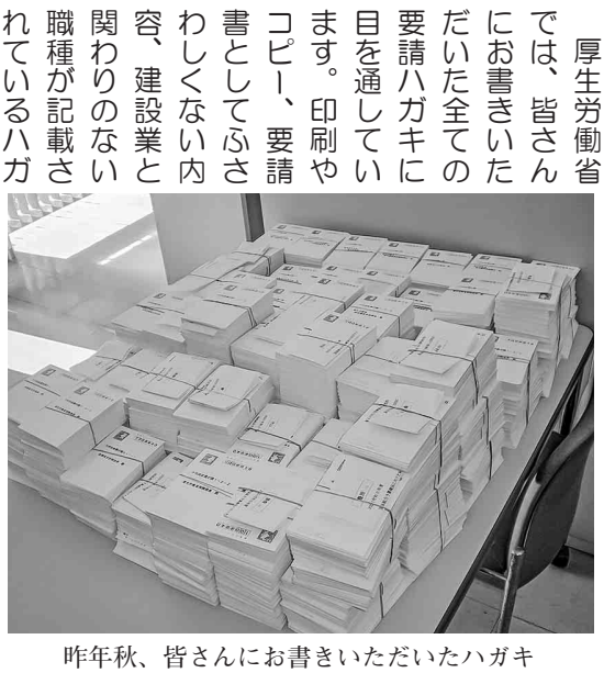
昨年秋、皆さんにお書きいただいたハガキ

二〇二五年度予算は高額療養費制度見直し等を巡って、国会審議が難航する中、三月三十一日に参院本会議で再修正案を可決した後、衆議院での同意を受けて、成立しました。 国保組合への現行補助水準確保の見通しを築くことができたのは全国の仲間の予算要求の運動の成果です。 大変重要な運動 私たちが加入している中建国保は、組合員の皆さんが支払う保険料と、国からの補助金で成り立っています。 ハガキ要請行動は、中建国保に加入している皆さんによる直接行動であり、国保組合に対する補助金確保をするために大変重要な運動です。政府の社会保障費を削減する方針は変わらず、子育て対策の社会保障費削減による財源の捻出、今回見直し凍結となった高額療養費制度も今年秋までに改めて方針を検討し決定