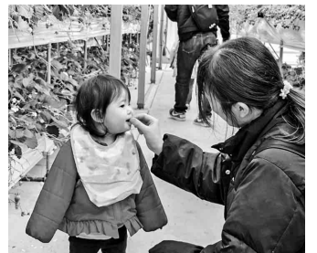
甘〜いイチゴをパクッ！

タイムトラベルしたようなワクワク感覚へと気持ちが高揚する。あっとい間にお腹も減る頃、「ホテル グランドコートナゴヤ」金山駅へ移動。ホテルの目の前にバス三台を横付け！さすがホテルのビュッフェでお肉からデザートから超豪華。偶然にも北海道フェア中で得した感じ。