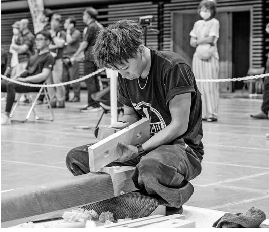
昨年の競技大会の様子

全建総連では、青年大工技能者の育成と技能尊重の気運醸成を目的に「全国青年技能競技大会」が開催されており、全建愛知からも優秀な技能を持った青年組合員が出場しています。