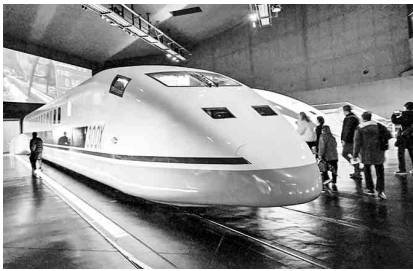
展示されている新幹線

津島支部では、二月二日に参加人数百七人でレクレーションを行いました。初めに向かった場所は「リニア・鉄道館」。歴代の列車がドーンと迫力満点に機関車からリニアまで展示され、さらに列車の中へ入ることも可能で、まるで