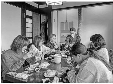
和気あいあいとした雰囲気での懇親会

に双子の女の子も参加してくれました。贅沢だと、美味しい料理に皆さん笑い顔で喜んでいただけました。今年度の主婦の会のレクの感想や今後行きたい場所、やりたい事などいろいろな話が聞けました。