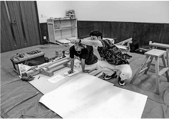
昨年の講習会の様子

参加者の中で優秀な方には、二〇二五年九月十三日(土)〜十五日(月・祝)の三日間、山口県山口市(維新大晃アリーナ)で開催の「第四十二回全国青年技能競技大会」に全建愛知代表選手として出場していただく予定です。