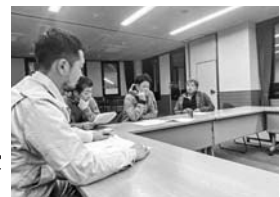
熱心に耳を傾ける参加者