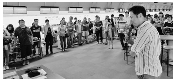
多くの家族が参加

八月二十日(日)、豊田支部では健康促進企画としてボウリング大会を今年も開催致しました。場所は美鳥里ボウルで行われ総勢八十名弱の組合の方々に参加して頂きました。ご家族での参加が多く二十二人もの場所を貸し切り、とてもファミリー感溢れる素晴らしい雰囲気での大会となりました。 さて、支部長の高らかな開催宣言の後、各プレイヤーの投げる姿は真剣そのもので、一投に一喜一憂し、ストライク賞からガーター賞まで用意されたたくさんの景品を皆さん楽しそうに掴み取ってはまた投げ、ニゲームでも盛り上がり、大会となりました。 部屋を移動して行われた