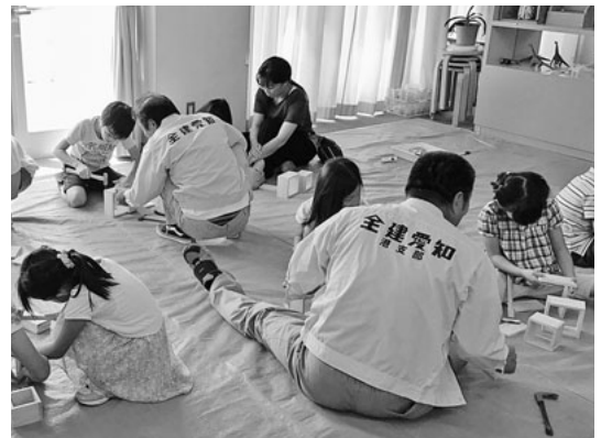
だんだん形が出来てきた

を完成させました。参加者は女の子が多く初めてのこぎり、金槌を持つという子がほとんどでした。釘をまっすぐ打てるの大変喜んでいました。 絵や飾り付けが終わり満足した笑顔で、「先生ありがとうございました」とお礼を言われると、やって良かったなあとこちらで嬉しくなり、また機会をいただければ喜んで指導したいと思っています。