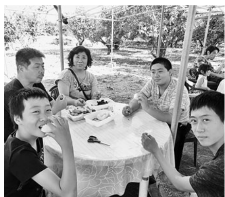
みずみずしいフルーツも食べ放題