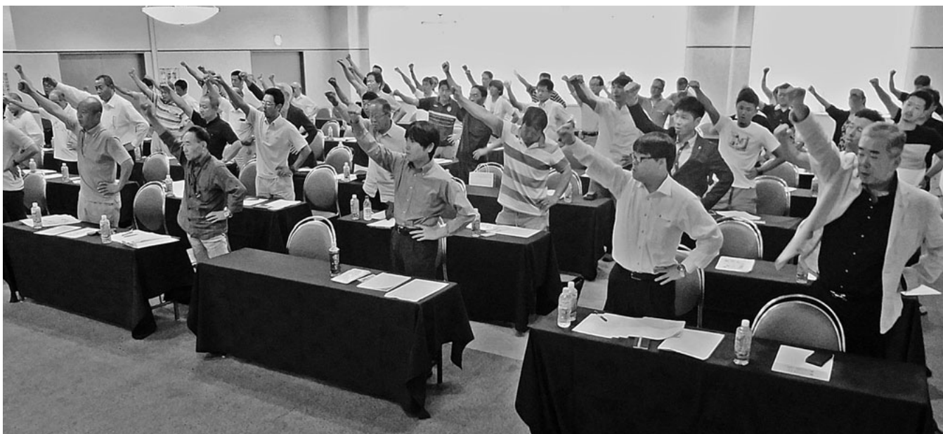
秋の組織拡大強化月間にむけ団結ガンバロウ

全建愛知組織部は八月二十七日(日)に「全建愛知組織拡大出陣式」を名古屋市千種区の浩養園で開催しました。全建総連/奈良統一組織部長をお招きし、二十七支部から総勢七十名が集まりました。出陣式終了後には懇親会も行い、より一層団結力を強めました。