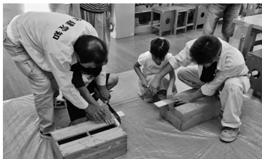
大工道具に初めての挑戦