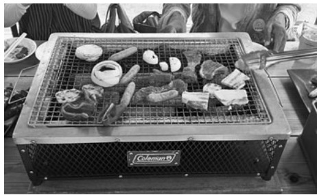
採りたて野菜でバーベキュー

られるご家族もありました。お昼には園内でのバーベキューが始まり、ご家族で園内栽培されている季節野菜の収穫体験をしました。