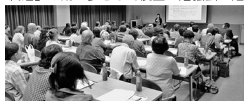
一昨年前の勉強会(エンディングノートの書き方)の様子