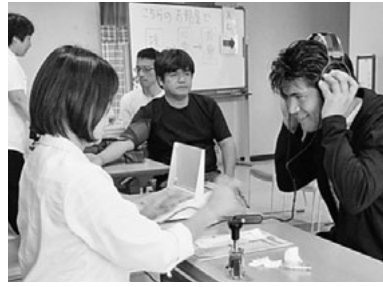
集団健康診断の様子