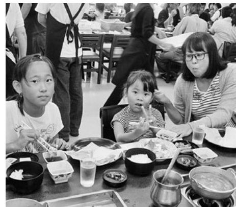
いっぱい食べるよ～

は、大人のお楽しみマルスワイスキー場で試飲とお買い物。そしてお待ちかねの梨、ぶどう、プルーン、りんご狩り。どれも美味しいか食べべ。園内のゴザを借りて家族でピクニック気分を楽しみ良い思い出ができました。帰りは恒例のビンゴゲームで盛り上がり、少し遅れましたが無事に帰路へつきま