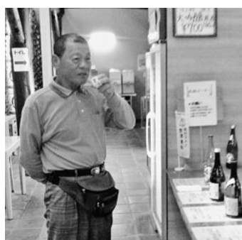
じっくり利き酒を楽しむ