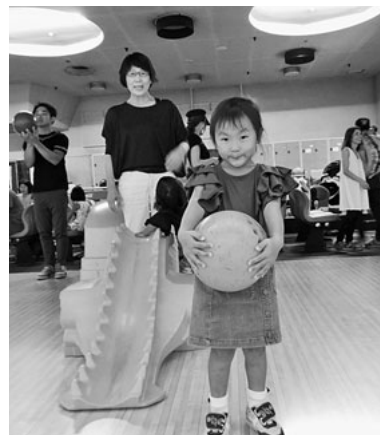
ピンまで届くかな～