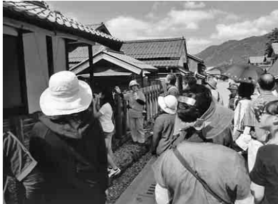
ガイドさんの説明を聞く参加者