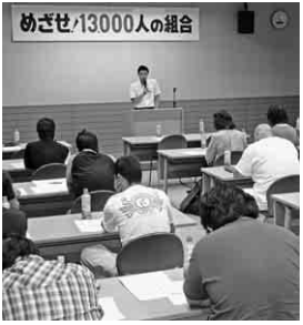
めざせ!13000人の組合 青年部・主婦の会コースの様子

全建愛知 全愛知建設労働組合 〒455-0008 愛知県名古屋市港区九番町4-1-10 ☎ (052)659-0288 FAX (052)653-0181 ☎ 0120-154-931 ☎ 050-3785-1684 E-mail: honbu@zenken-aichi.com