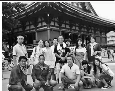
浅草寺でハイチーズ

去る九月六日(金)〜八日(日)、津島支部設立五周年記念行事のディズニーストリート・浅草観光ツアー(総勢五十五名)に家族四人で参加させて頂きました。