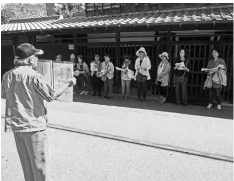
伊藤家の前で説明を聞く幹事