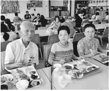
頭付きエビフライ最高

九月二十九日(日)、中支部レク「熊川宿鯖街道ウォーキングと海鮮バイキング」に総人数二十七名で行ってきました。熊川宿では、