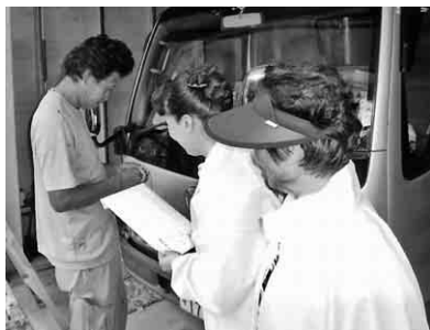
現場へ訪問し組合説明をする女性役員

消費増税負担が大きくなれば建設に従事する労働力の外注化に拍車がかかり、不安定な労働環境で働かざるを得ない人が増大することです。さらなる社会不安が広がります。小零細な建設事業者を苦しめる価格転嫁問題に對しては特別措置法で対処するとしています。その有効性には疑問です。