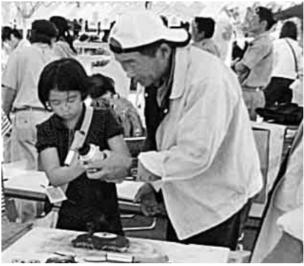
熱心に指導する役員