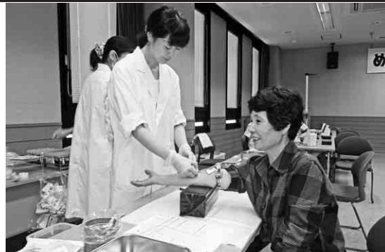
集団健康診断の様子

健康診断の受診資格 但し、二十歳未満の家族被保険者の方が希望する場合は、実費負担(一万円)で受診いただけます。 ※中建国保未加入の組合員及び組合員外は受診できません。 ※中建国保に未加入の組合員は加入している医療保険者(市町村・協会けんぽ等)へお問い合わせください。また、中建国保未加入の組合員は、年一度は必ず健康診断を受けましょう。