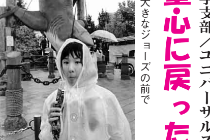
大きなジョーズの前で