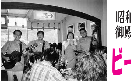
生演奏で気分も最高潮

は、可動本立て・動物の顔鍋敷き・テッシュBOXを子供たちが組合員の指導を受けて作り上げ、物作りの楽しさを味わい笑顔で持ち帰りました。まな板コーナーには、主婦が集まり好みの大きさのまな板を選び出していました。中には「家内から頼まれた」と言いつつ、主人が寸法を書いてきて選んでいました。今年も品物を販売するのは無くして寄付をしてもらい、その金額は十万円近く集まり、その場で福祉団体に寄付をしました。 【青木繁通信員】