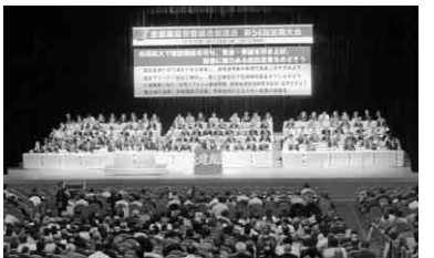
全国から1,419人が参加

全建総連第54回定期大会 組織拡大で建設国保を守り、賃金・単価を引き上げ、若者に魅力ある建設産業をめざそう 全国の仲間1,419人参加