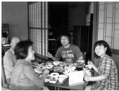
焼き立て揚げたて、最高

九月十五日(日)、東海支部は館山寺温泉ランチバイキングとメロン狩りへ総勢百四名が参加しました。出発時は、台風十八号が接近していましたが、天候は予想外で一粒の雨も降