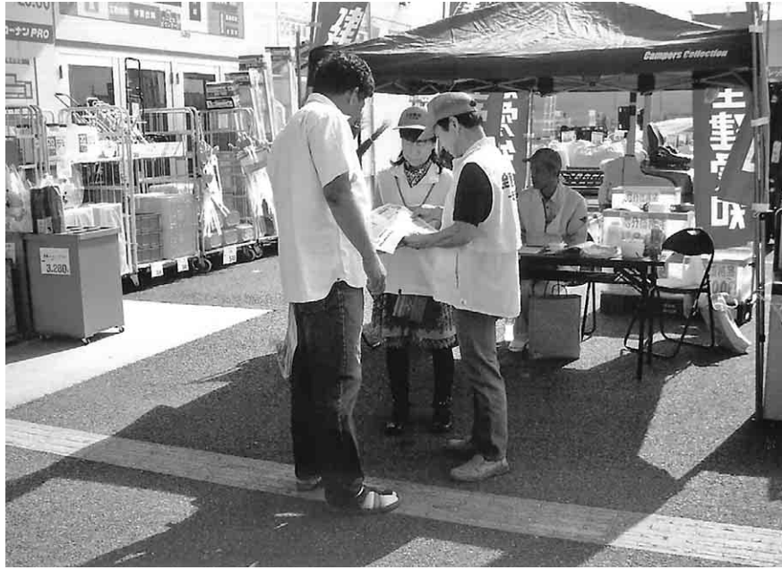
ホームセンターの入口付近で、買い物に来た職人さんに組合説明をする役員(右・中)

消費増税負担が大きくなれば建設に従事する労働力の外注化に拍車がかかり、不安定な労働環境で働かざるを得ない人が増大することです。さらなる社会不安が広がります。小零細な建設事業者を苦しめる価格転嫁問題に對しては特別措置法で対処するとしています。その有効性には疑問です。