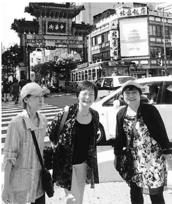
中川熱田支部 散策中人がバス三台に分乗して、秋晴れの九月二十一日(土)〜二十一日(日)泊二日の東京・横浜への支部旅行

車窓から眺めた浅草、浅草寺には多くの人で大賑わいにびっくりしました。東京スカイツリーに着いた時は、展望デッキからの夕焼けが美しく、また宿泊ホテルに向かうバスから眺めたライトアップされたスカイツリーにも歓声があがりました。マスコットキャラクターのソラカラちゃん握手をしたりしてニコニコ顔の子ども達。翌日も晴天で、人気の横浜中華街・異国情緒たつぷりの山下公園・赤いレンガ倉庫・おしゃれな元町等を散策しました。「スカイツリーも泊まったホテルも食事もよかったです」等、帰路のバスの車内には満足した参加者の顔がいっぱいでした。