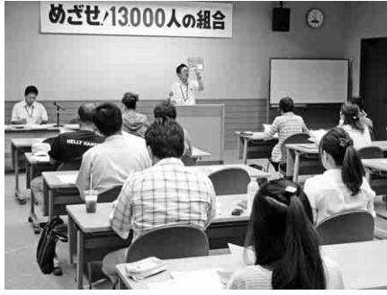
税金講習会の模様

税金や記帳について不安や疑問をお持ちの方は、二月開催の全建愛知税金申告学習会の前に必ずご参加ください。