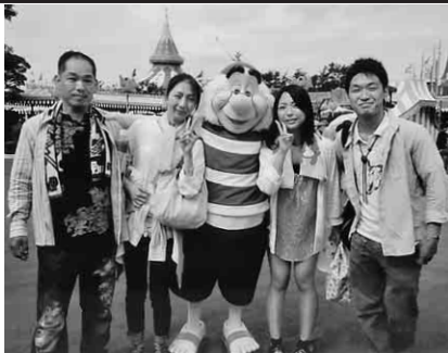
とっても楽しいですよ

去る九月六日(金)〜八日(日)、津島支部設立五周年記念行事のディズニーストリート・浅草観光ツアー(総勢五十五名)に家族四人で参加させて頂きました。