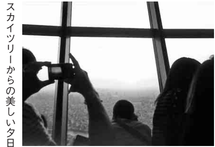
スカイツリーからの美しい夕日

車窓から眺めた浅草、浅草寺には多くの人で大賑わいにびっくりしました。東京スカイツリーに着いた時は、展望デッキからの夕焼けが美しく、また宿泊ホテルに向かうバスから眺めたライトアップされたスカイツリーにも歓声があがりました。マスコットキャラクターのソラカラちゃん握手をしたりしてニコニコ顔の子ども達。翌日も晴天で、人気の横浜中華街・異国情緒たつぷりの山下公園・赤いレンガ倉庫・おしゃれな元町等を散策しました。「スカイツリーも泊まったホテルも食事もよかったです」等、帰路のバスの車内には満足した参加者の顔がいっぱいでした。