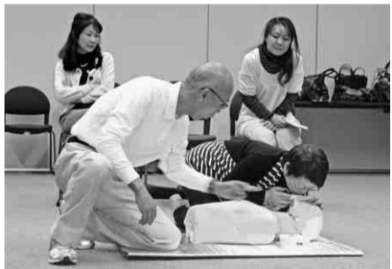
講師の指導のもと、人工呼吸をする幹事