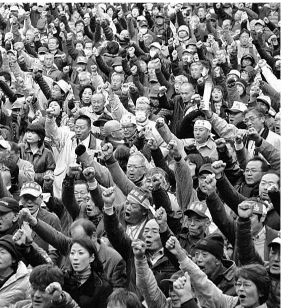
建設不況打開と生活危機突破、予算要求を実現するために中央総決起大会を昨年11月21日に開催しました

来年度(二〇一三年度)の政府予算案が一月二十九日(火)閣議決定され、国保組合関係の予算案については、総額で三千三百三十五億一千万円(対前年度比八十七億二千万円減)となりました。 厚労省保険局国保課によると、二〇一三年度予算において、前年度に比べ減額されているのは、国保組合の被保険者数の減少などにより、結果として予算額が縮小されたことが理由であると説明しています。