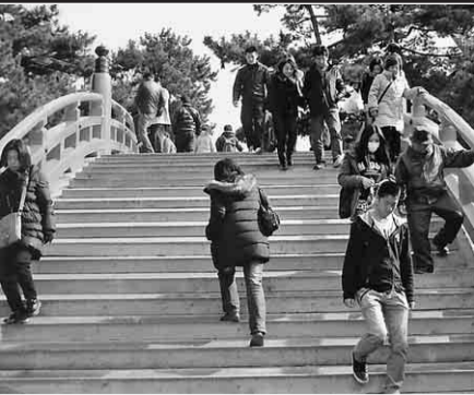
太鼓橋をヨイショヨイショと渡ります

と大阪の人々に親しまれている住吉大社参拝と道頓堀散策の旅に、今年も大勢(組合員二十九名・家族三十八名/計六十七名)の方に参加していただきました。