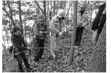
説明を真剣な様子で聞く幹事

午後、いよいよ木登りの実践です。午前中に学んだ事を応用して、実践すると意外と登れました。