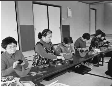
笑いの中にも真剣に作業を

一月十九日(土)福岡校区市民館において、さるぼぼ作りをしました。講師はおなじ主婦の会