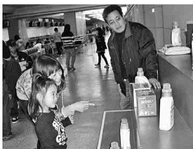
どれにしようかな