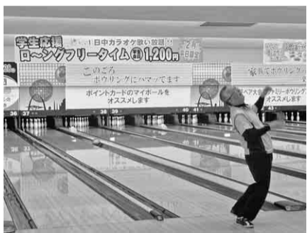
あ〜今年もガーターだあ