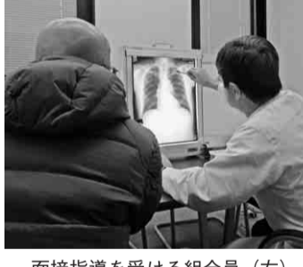
面接指導を受ける組合員(左)

石綿関連疾患検査面接指導実施 毎年、検査をお受けください 平成二十四年四月から十月の間に集団健康診断等を受診され、石綿関連疾患検査を希望された千二百三十五名中、二十三名の方と、過去の面接指導欠席者九名の方が、今回の面接指導の対象となりました。 この内、九名の方が一月