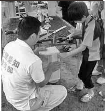
十月二十二日(土)、緑区民まつり大高緑地公園にて「住宅デー」と称して「親子でスパイスラック作り」・「檜の丸太切り」・主婦の会では「折り鶴(世界平和を願う献納折り鶴)」