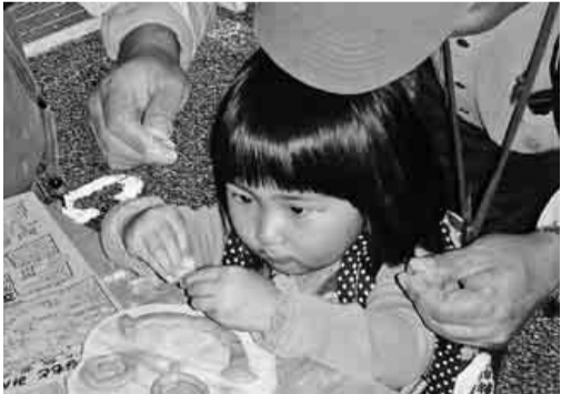
真剣な眼差しの子

10月30日（日）守山支部は、守山生涯学習センターまつりに初めて参加し拡大行動を行いました。 今回は丸太切りと木工・鍋敷きの製作指導をしました。 パンダ、牛、ペンギンの型の木の上に粘土で作った目や口などの模様を置きバーナーで表面を焼くと粘土の所だけ木の面が残り、バラエティ豊かな表情の作品に仕上がるのです。子供たちは思い思いにデザインし、夢中になって作っていました。途中から雨が降り出してしまいましたが、年配の方も多数参加され、列が途切れる事がない程好評でした。