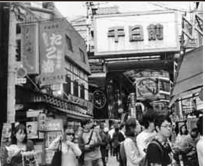
大勢の方で賑わっています

丸太切りに奮闘 二十一日の夜から明け方まで大荒れの空模様でしたが、参加者皆さんの日頃の行いがよく、午前六時五十九分の東海ラジオから予定通り開催との放送でした。限定三十個のスパイスラックも丁寧にそれぞれに力作に仕上げられ、笑みを浮かべる親子。 丸太切りではアロマテラピーとして檜の心安らぐ薫りと共に鍋敷きや玄関の鉢植えの台にと持ち帰って頂きました。 収益は例年通り緑区社会福祉協議会へ全額寄付させて頂いた頂きました。 【小川眞弘 記】