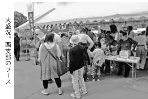
大盛況。西支部のブース

西支部は、十月二十三日(日)に西区民まつりとの共催で「住宅デー」と組織拡大行動を行いました。前日の二十二日(土)に役員が二組に分かれて、建設と高橋建設との作業場で材料の用意を行いました。この日は雨降りで、天気予報では、二十三日も午前中は雨が降るような予報が出ていました。当日になると天気も良くなり、大勢の人が来場して「まな板」のコーナーには、開始時間の前から奥様達が集まり、好みの大きさのまな板を取り、おまけの「まな板」を持って帰る方も多く見られました。午前中、すべて無事終了しました。この日は、笑顔で帰りました。