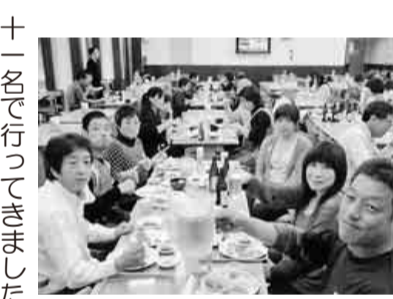
運動の後の食事は最高

津島支部/健康体力づくり 広い園内を使いウォークラリーとクイズが合体したラリーゲームで、五名程のチームに分かれてヒントを頼りにチェックポイントを探し当て、時間内にいくつクリア出来るかを競います。各ポイントには難問・珍問があり、頭脳と体力を使う楽しいゲームです。ゲーム開始早々に雨が降りだしましたが、みんな頑張って歩き回りました。ゲーム終了後は表彰式、そして楽しみにしていたランチバイキングです。みんな大満足の一日でした。 【佐藤伸吾通信員】