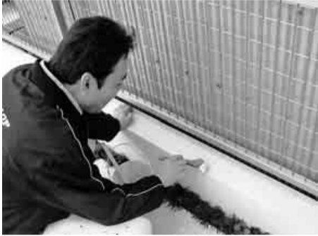
外構の塗装工をする萩上会計

僕は、塗装業をしています。塗装業を始めたきっかけは、友達が先に働いていて軽い気持ちで一緒に働いたのですが、それから20年近く、ずっと塗装業をしています。