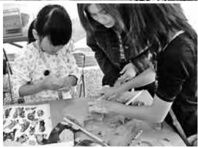
上手に出来るかな

主婦の会の方も全建愛知のピラの入ったティッシュと手作りの楊枝入れを配り、来場者にアピールしました。皆さんお疲れさまでした。