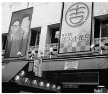
本場のなんばグランド花月

十月二十三日(日)、瑞穂支部恒例の秋季支部レクを行いました。今回のレクは、趣向を変えて吉本新喜劇観劇会を実施しました。四十名募集が五十七名の応募があり、結局四十八名が参加し、外れた人には、今回は辞退していただき、次回の参加をお願い致します。