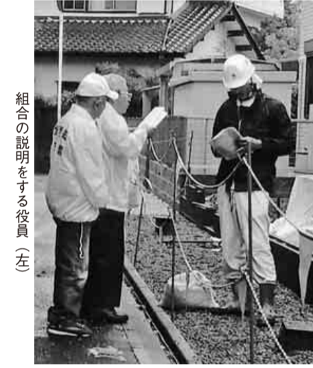
組合の説明をする役員（左）

10月15日（土）小雨が降る悪天候の中、千種支部・東支部の組織拡大行動が行われました。 朝9時半過ぎより、全建愛知東支部のメンバー5名が集まり、1人でも多くの未加入者の職人さんに組合制度をアピールできるように全員で意思統一をした後、碁盤の目のように工務店や建設現場を探しに回りました。 8件の工務店に組合の説明をすることができました。また、その中、1件建設現場を見付け、そこで作業する若い職人さんは、仕事にも関わらず早く話を聞いてくれ、組合の手厚い共済制度に関心があるようでした。 残念ながら、他の健康保険など入っているとの事でしたが、パンフレットは受け取っていただけました。 今後も、役員一同気持ちを新たにし組織拡大のため、粘り強く推進運動に努力していきます。