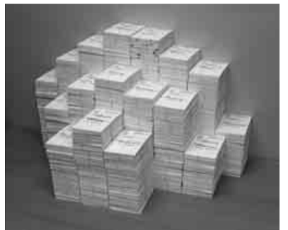
一斉投函する大きなハガキの山

共に順次提出される見込みですが、その見通しが不透明なことから、法改正による影響を見込まずに今回の概算要求はなされました。 定率補助等の見直しを見込まない概算要求となったことは、夏以降に取り組んできた、ハガキ要請行動・地元国会議員要請行動・中央行動等により私たちの国保組合への現行水準確保を目指した運動の成果です。 しかし、増額での概算要求となったものの、年末の予算編成に向け、定率や調整補助金、特定健診・保健指導補助金等に対する厳しい切込みが予想されます。 全建総連では、建設国保に対する「現行補助水準確保」を訴え、政府予算の確定する年末ギリギリまで全力で予算要求運動を取り組まなければなりません。 ご奮闘に敬意を表します