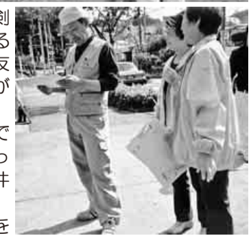
女性役員も大活躍