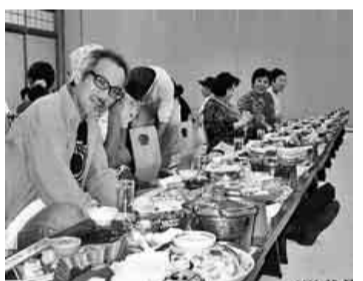
美味しそうな食事です

十月二十三日(日)支部レクが行われ、組合員とその家族七十七名が参加しました。小牧市役所駐車場に集合し、全員がそろって穂高に向けて出発です。名神、東海北陸道を走り、高山に着くころには雨もあがり気分も爽快、平湯温泉に到着しました。飛騨牛しゃぶしゃぶの屋