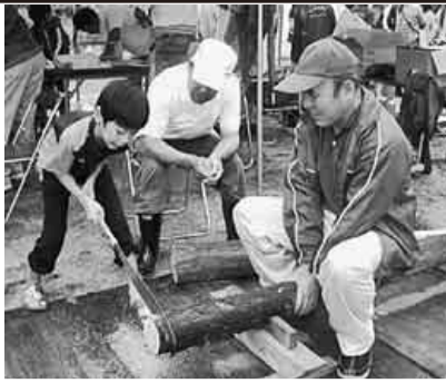
十月二十二日(土)、緑区民まつり大高緑地公園にて「住宅デー」と称して「親子でスパイスラック作り」・「檜の丸太切り」・主婦の会では「折り鶴(世界平和を願う献納折り鶴)」