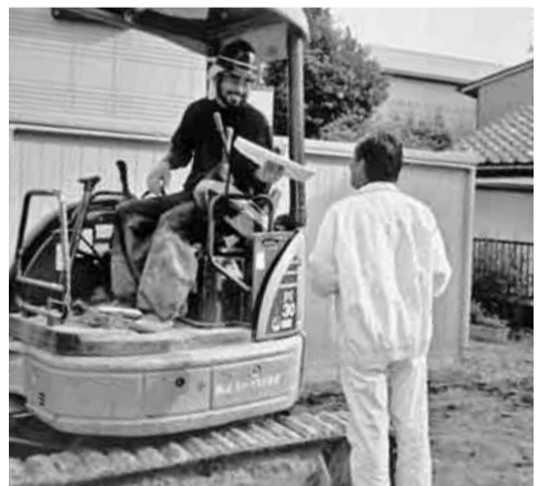
現場を訪問し話しかける役員（右）

10月20日（木）昭和支部は、組織拡大を行いました。 朝10時川原神社境内に7名の役員が集まり、2台の車に分乗し東西に分かれてそれぞれ出発しました。 回って見ると、新築工事は少なく、塗装工事の多いのに気づきました。 ある現場でパンフレットを渡しながら、「全建愛知です。話を聞いて下さい」と云うと、お仕事にも関わらず真剣に耳を傾けて下さいました。又、ある現場では、「検討してみます」とか「友人にも話してあげるよ」などの返事が返って来ました。 その人達の大半は、名古屋市以外でしたが、組合の事を1人でも多く知ってもらおうと回った件数は70～80件になりました。 そのすべての人にパンフレットを渡す事ができ、これからも昭和支部は組織拡大にがんばってまいります。