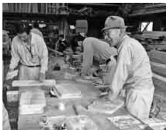
前日から材料の準備をする役員