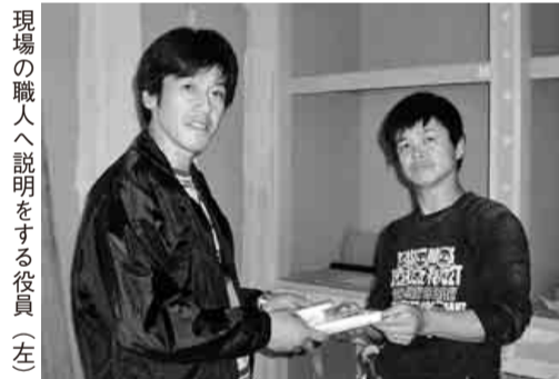
現場の職人へ説明をする役員（左）

「パンフレット」グッズ等、タオルなども気持ちよく受け取ってくれました。 中には、仕事が忙しく無視される職人さんもいましたが、資料を渡すと受け取って「考えとくわ」の声もありました。又、組合員さん宅へパンフレット等渡し未加入者の職人さんの紹介をお願いしてきました。 これからも支部一同で、組合員さんを増やすことをアピールしていきたいです。