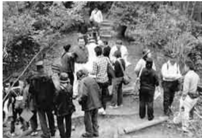
皆さんウォーキングとクイズを楽しんでいます

十月三十日(日)津島支部は、健康体力づくりで静岡県掛川市にあるヤマハリゾートつま恋に七十一名で行って来ました。去年もここにきて別のゲームを楽しみましたが、今年はスカベンチャーラリーというゲームをやりました。