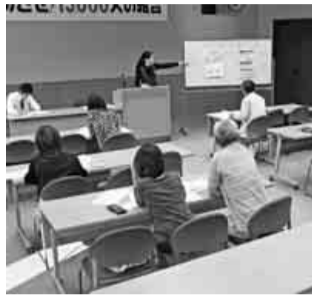
税金講習会の様子

課税売上が一千万円を超えた事業者は、その二年後 が消費税の課税事業者にな ります。 また、簡易課税制度を選 択される方は、課税事業者 になる年の前年未までに （平成二十二年が一千万円 を超えた方は本年中に）簡 易課税制度選択届出書を 所轄税務署に提出する必要 があります（前回の申告で 簡易課税制度を選択してい る方は、改めて提出する必 要はありません）。