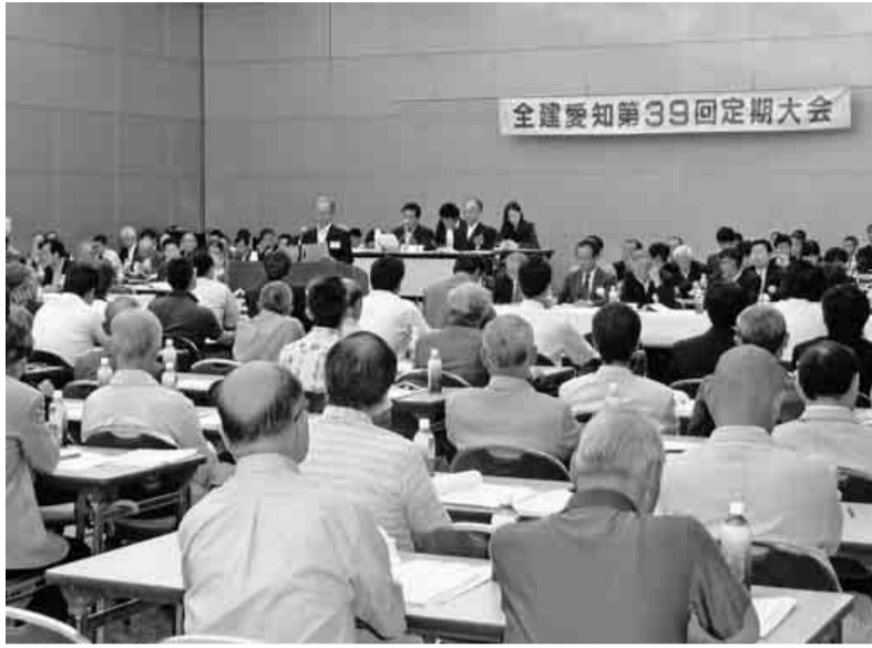
340名の多くの方々が集まった 全建愛知第39回定期大会