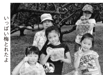
いっぱい梅とれたよ

た目を必死に開けゲームに熱中してました。青年部の皆さん、大成功でした。本当にお疲れ様でした。これからも支部のため宜しくお願い致します。【野田真次通信員】