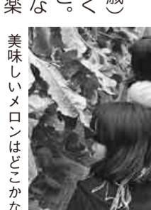
美味いメロンはどこかな

「主婦でもないのに主婦の会に参加してもいいの、とても不安でした」が、皆さんとても楽しくやっていて、そんな不安もいつの間にか忘れて楽しい一時を過ごせました。8品の料理と先生の作ってきた棒棒鶏、お弁当と…お腹いっぱい胸いっぱいです。これからもまた参加したいと思えます。ありがとうございました。