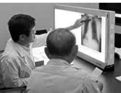
面接指導を受ける組合員(右)

面接指導では、出席者の既往歴・職歴の聞き取りと、健康診断等で撮影されたX線写真の読影から、石綿によるばく露の有無を確認し、その結果、CT撮影による詳しい検査をします。【読影検査を希望される場合】アスベストに関する同意書を提出していただきます。(但し、二十一年度以降に同意書を提出された方は、提出の必要はありません)同意書を提出されると、集団健康診断受診時に撮影したレントゲン写真を読影いたします。尚、集団健康診断以外で受診された方は組合ヘレントゲン写真をお持ちください。