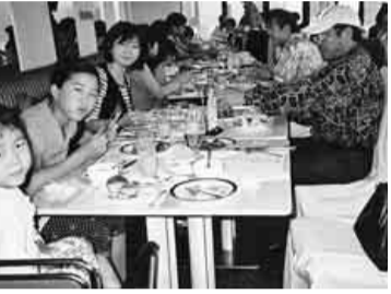
ステーキ美味しいよ