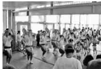
これが本場の阿波踊りです