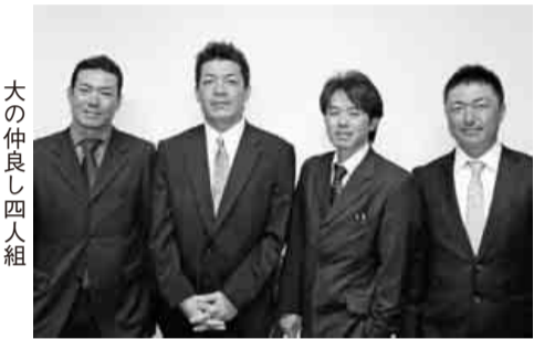
大の仲よし四人組