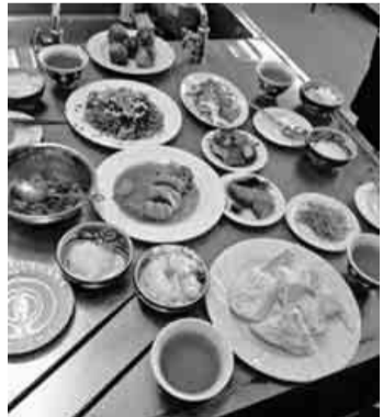
八品の料理が完成しました

しかし、炊飯器でやる時にはカレーや味噌の味がしみ出してしまうので、白ご飯がお好きな方はポットで調理がオススメです。