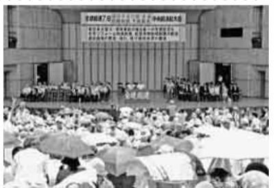
全国から約5,600人が集まった

中央総決起大会 全国の仲間五千六百人集結 七月六日(水)東京「日比谷公園大音楽堂」 建設不況打開 生活危機突破 予算要求