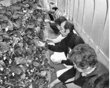
夢中でイチゴをとっています

次は、今日一番の目的イチゴ狩りです。イチゴは、とても甘く美味しくみなさん食べるのに夢中でした。【野田真次通信員】