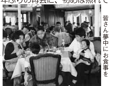
皆さん夢中にお食事を