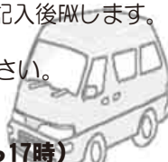
車種と料金表 標準コース1日（24時間）／消費税込