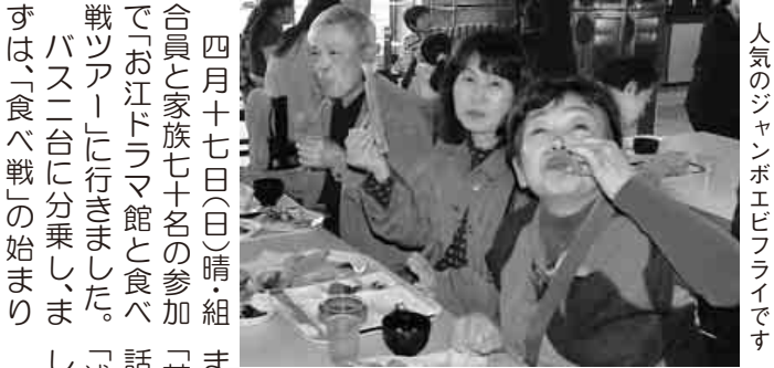
人気のジャンボエビフライです

四月十七日(日)晴。組合員と家族七十名の参加で「お江ドラマ館と食バトル」に行きました。「浅井民俗資料館を見学」は、「食べ戦」の始まりです。