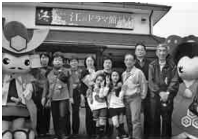
浅井・江のドラマ館にて

四月十七日(日)晴。組合員と家族七十名の参加で「お江ドラマ館と食バトル」に行きました。「浅井民俗資料館を見学」は、「食べ戦」の始まりです。