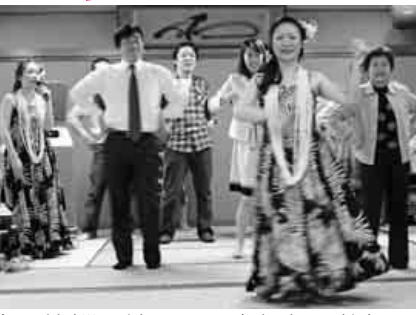
一緒に踊ってフラダンスの勉強

一宮支部では総会・懇親会を4月24日(日)午後4時15分総会(15分遅れ)、懇親会を午後5時10分頃から執り行いました。