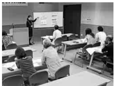
税金講習会の様子

愛知県職業訓練会館二階 名古屋西区浅間2-3-14 実技会場は、 県立名古屋高等技術専門学校