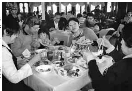
美味しいランチを堪能

4月16日(土)、全建愛知千種、東支部合同で「琵琶湖クルーズ・ランチバイキングの旅」に、合計45名で参加しました。