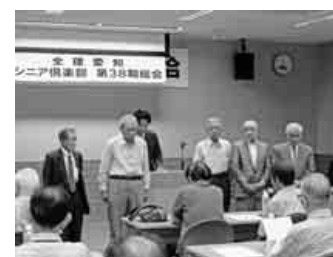
前回の総会の様子

シニア倶楽部が設立され、約3年になります。現在では、会員の方々に研修旅行等を通じ、仲間同士の交流を深めてもらい、活発に活動しています。