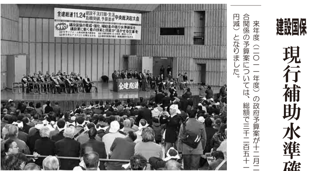
昨年11月24日に全国から6,074名の仲間が集結した中央総決起大会

来年度(二〇一一年度)の政府予算案が十二月二十四日(金)閣議決定され、国保組合関係の予算案については、総額で三千二百五十一億三千万円(対前年度比三億八千万円減)となりました。 二〇一一年度予算案では、①定率補助金・普通調整補助金・特別調整補助金の補助体系の維持、②普通調整補助金と特別調整補助金の合計額で増額を確保、③建設国保の定率補助金三十二%を守るとともに、定率補助の見直しを内容とする国保法の改正が二〇一一年度からとなったことにより、全建総連が強く求めて