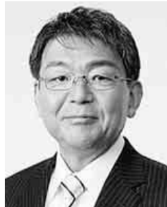
愛知県知事選挙候補者 みその慎一郎