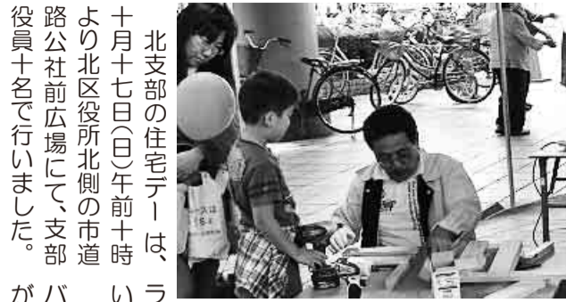
熱心な指導の役員(右)

北支部／住宅デー 大きくなったら大工さんになるぞ 北支部の住宅デーは、十月十七日(日)午前十時より北区役所北側の市道路公社前広場にて、支部役員十名で行いました。