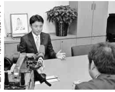
テレビ取材に対応する古本議員

いつもお世話になります。選挙区は、豊田市とみよし市です。自動車と県下屈指の農業、多くを占める森林、矢作川が三河湾まで流れます。この豊かな地域が大好きです。 さて、初当選から「税は社会を創る」という信念で取り組んで参りました。京都を訪れた方は、ご存知と思いますが京の町家はうなぎの寝床と言われます。かつて、間口の幅で税金が決まり商人たちが間口を狭くして節税したためです。細長い通路を抜ければ、奥にはお屋敷がある町並みができました。税制により社会を創る、町並みさえ変えることができるのです。小職は、一昨年の1年間は財務大臣政務官として政府税調を運営して参りました。そして、昨年の1年間は党の税制改正PTの事務局長として党側から23年度税制改正にあたり皆様から頂いた声を党として提言して参りました。 そこで、所得の再分配機能の見直しを紹介します。現在、日本の世帯収入は年収200万円を暮らす方々が1,000万世帯を超えます。一方、年収1,500万円を超える世帯は、自民党政権の時代に減税が行われてきました。物の値段が下がるデフレ経済から脱却できない中、政治はどうすべきか悩みました。結論は、一定の所得層以上、年収1,500万円の人を増税し、その財源を社会保障サービスとして低所得層の方々に給付すれば社会全体で支えあおうと考えました。難しい言葉ですが「所得の再分配」と言います。23年度の税制改正の目玉はこうした点を重視して個人所得税等を見直しました。年収200万円を暮らす方々の給料が少しでも上がりボーナスもきちんと支給されるだけの仕事があり、物が売れるのが一番です。 しかし、経営者も日々の運転資金に苦しみます。こうした状況を抜け出すには個人の可処分所得を増やすべきであり、そのために国家が所得を再分配することも意味があると考えます。 こうした税制を通じ本年が必ず良い年になります様、政治も頑張ります。 【古本伸一郎衆議院議員 記】